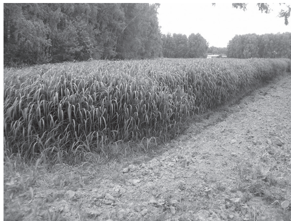
Рис. 1. Июньские всходы мискантуса после посадки во второй половине мая, слева; 8-летняя плантация мискантуса в августе, справа, Новосибирск, 2008.

множения позволяет существенно упростить рассадку растений: во-первых, корневища легко отделить друг от друга; во-вторых, они легко укладываются в борозды сплошной лентой.